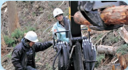
太子清流高校 森林科学科

3校の学科(コース)では、全国募集を行っています。もちろん、県内からも出願可能です。