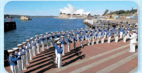
大洗高校 普通科音楽コース