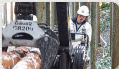
大子清流高校 森林科学科

次の3校の学科(コース)では、全国募集を行っています。もちろん、県内からも出願可能です。