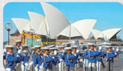
大洗高校 普通科音楽コース